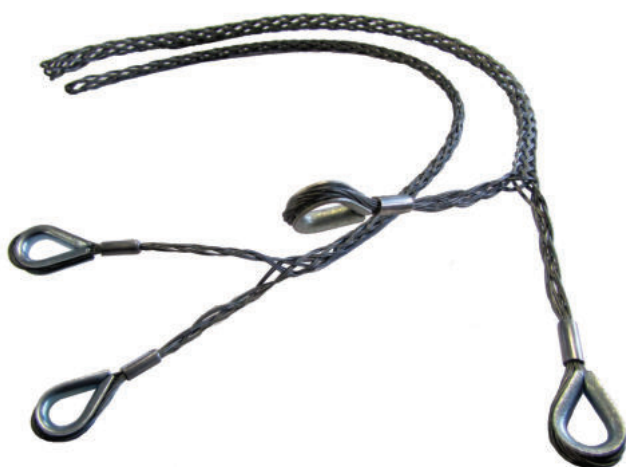
Serie calze metalliche di sicurezza per ancoraggio terminali flessibili