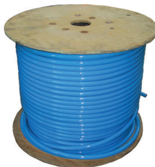
Serie completa di tubazioni flessibili p. max 3200 bar